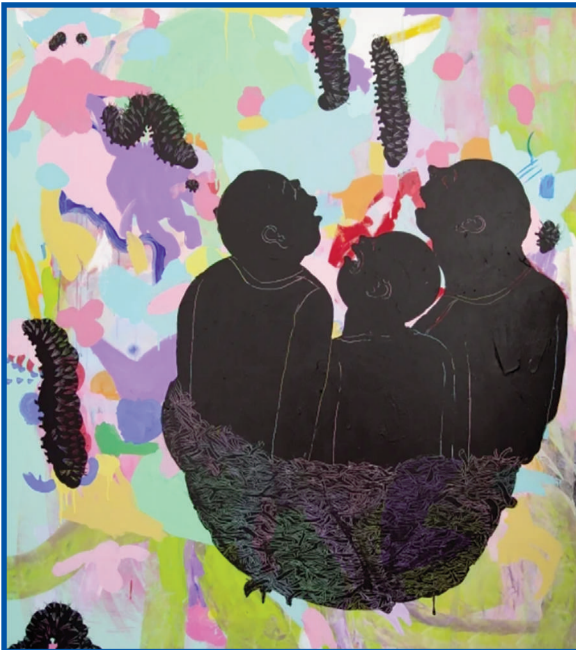
Jitka Petrášová – Kukaččí vejce (2023)

Kouká na něj. Kouká mu přímo do očí. Kouká na jeho rozjedený jídlo, má od něj pokapanou mikinu, musel být opravdu hladový. Kouká na tu špinavou mikinu a na jeho vousy. Má neoholené vousy a hluboký vrásky. Vypadá unaveně.