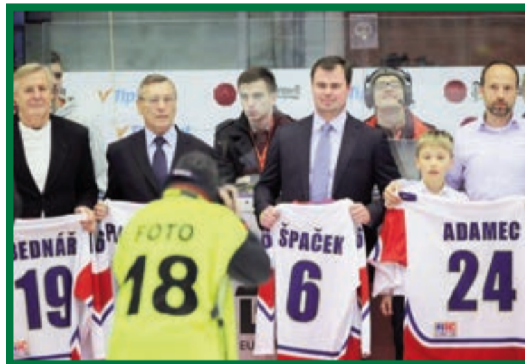
Noví členové Síně slávy před utkáním v Plzni.

Posledním z oceněných hokejistů byl Jaroslav Špaček, olympijský vítěz z Nagana a trojnásobný mistr světa. Špaček,