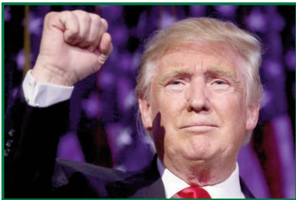
„Je čas se sjednotit. Budu prezidentem všech.“

Přestože ve všech státech Hillary Clinton i Donald Trump do poslední chvíle výrazně agitovali a ve většině z nich se přízeň nakláněla na stranu demokratické kandidátky, po úplném