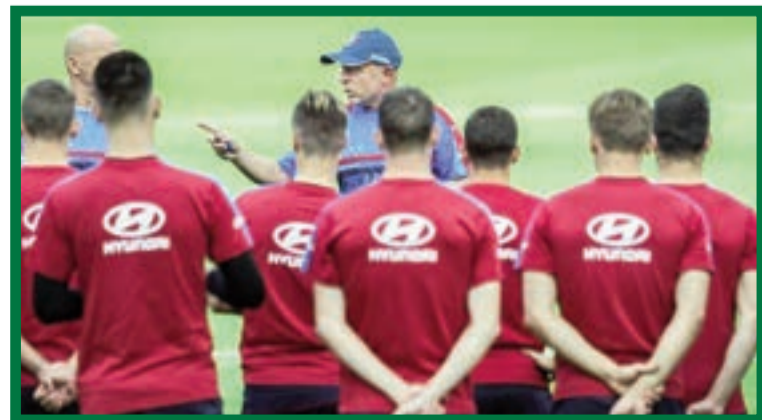
Trenér Jarolím během předzápasového tréninku.

Útočníci: Patrik Schick, Milan Škoda, Michael Krménčík