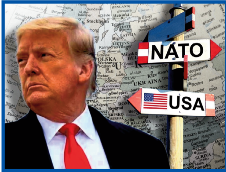
Trump ukazuje, že se o Evropu starat nebude.

Trumpova administrativa dává jasně najevo, že status quo, který platil přinejmenším od konce studené války, že Spojené státy garantují bezpečnost i partnerům v Evropě, je minulostí. I proto nyní všem jednáním představitelů EU dominuje obrana. Podíváme-li se na čísla vyjadřující sílu evropských států v potenciálním souboji s protivníkem, jakým je dnes třeba