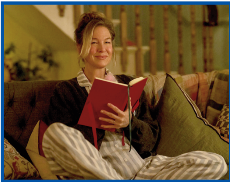
Bridget Jones se naposledy vrací. Přináší s sebou nové každodenní problémy i milostná dobrodružství.

Příběh vdovy se dvěma dětmi není na filmových plátnech něčím mimořádným. Když ale vezmeme v potaz,