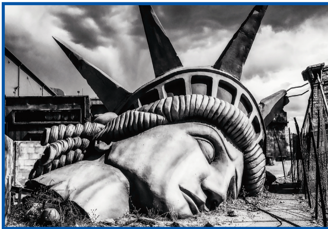
Svoboda dostává ve Spojených státech poslední dobou zabrat.

Lídr demokratických senátorů Charles „Chuck“ Schumer požaduje důsledné vyšetření incidentu. Poznamenal, že zprávy sdílené ve skupině se mohly dostat k nepřátelům Spo-