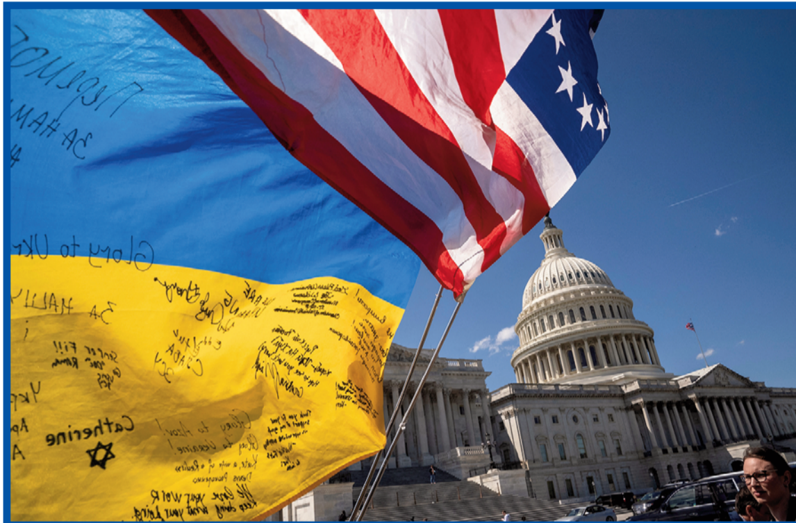
Ukrajina doufá, že tato americká finanční pomoc nebude poslední.

Rozkol je vidět i na hlasování kongresmanů – nadpoloviční většina reprezentantů republikánské strany se totiž vyslovila proti těmto zákonům. Ty tedy prošly hlavně díky hlasům demokratických reprezentantů, kteří