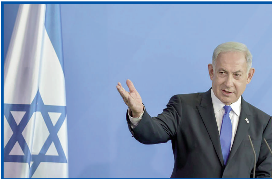
Jakou strategii nakonec izraelský premiér zvolí?

Vojenskou operaci naopak vítá teroristická skupina Hamás. Domnívá se, že na ní má Írán přirozené právo a považuje ji za zaslouženou odpověď na útok na íránský konzulát.