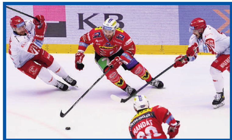
Série Pardubic s Třincem je vyrovnaná.