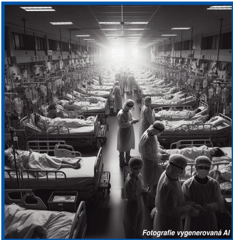
Fotografie vygenerovaná AI

Jako by globální pandemie covidu-19 nestačila, druhá nejlidnatější země světa se teď potýká s další nemocí. Čínu zasáhla nákaza suchým zápalom plic, kterým trpí hlavně nejmladší. A bude huň, první případy hlásí i Česko!