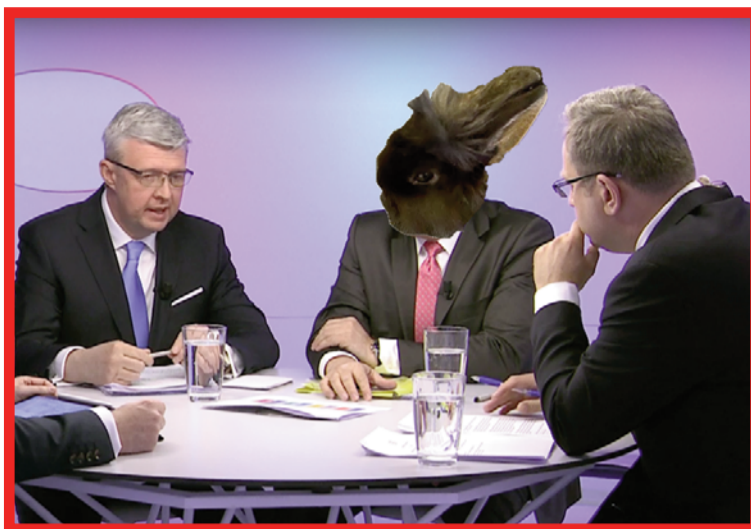
Křupinka nestačí zřít.

I králíci to mají v dnešní době těžké, i když co se různorodostí nabídky příslušenství týče, v poslední době zažívá chovatelství domácích králičků revoluci. Křupinka má domeček a také tunýlek, který může okusovat, což je pro králíka zásadní, kvůli broušení zubů. Z klece může dokonce vyskakovat na