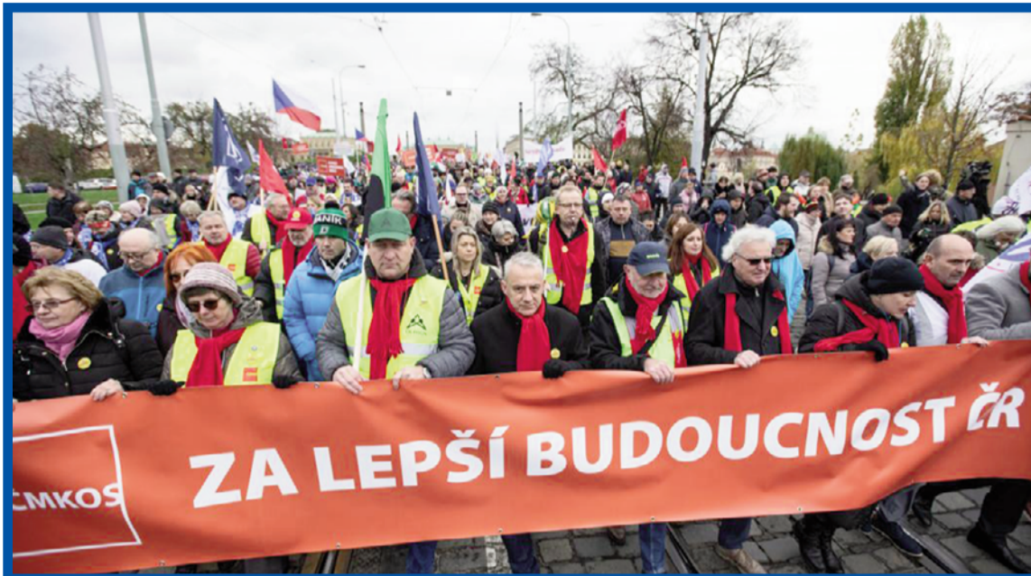
Davy nespokojených občanů vyšly do ulic, nelíbí se jim pokles životní úrovně a poslední kroky vlády.

Pražští středoškoláci kolem poledne uspořádali protestní pochod centrem Prahy, studenti střední pedagogické školy z Mostu pak přetextovali