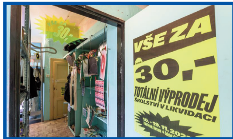
Instalace z výstavy Pokoje.