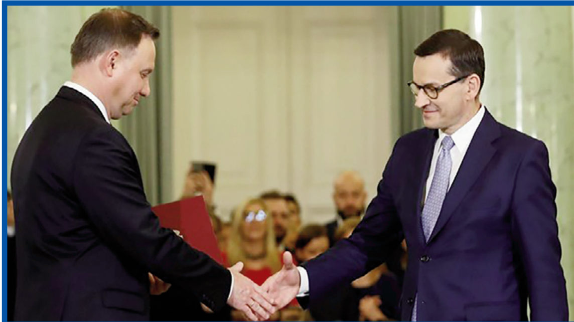
Andrzej Duda a Mateusz Morawiecki.

Prezident sice své rozhodnutí komentoval tím, že v opozici vznikají první spory a odvolával se na tradici pověřením sestavením vlády vítěze voleb, důvody jeho preferencí jsou ale