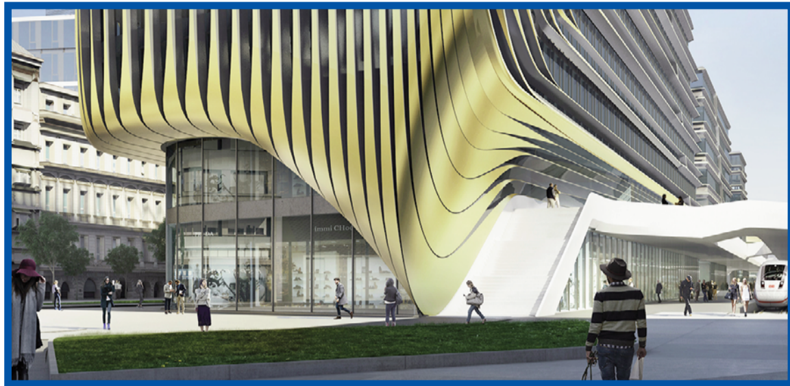
Návrh revitalizace Masarykova nádraží.