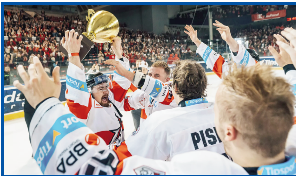
Hokejisté UK slaví vítězství nad ČVUT.

Diváci si tribunu stadionu, jenž hostil čtyři hokejová mistrovství světa,