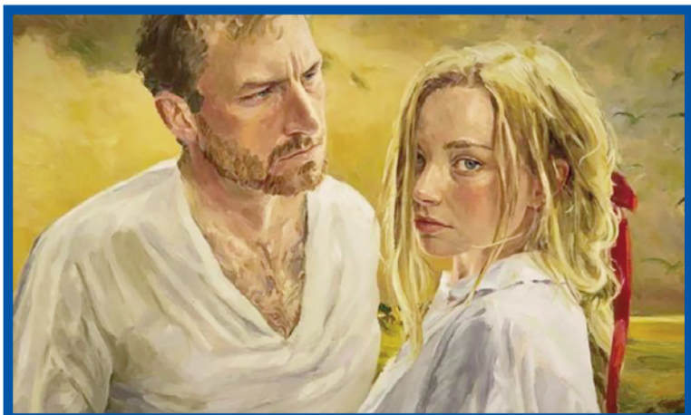
Obraz ze snímku Jagna.