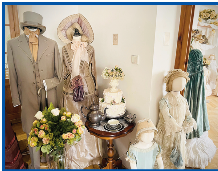
Kolekce dobového oblečení

V hlavní části expozice je pro návštěvníky vyobrazena scéna honosně prostřeného stolu spolu se stříbrnou servírovací mísou a krásným drahým porcelánem. Takto údajně zasedala ke stolu královna Viktorie s rodinou, ná-