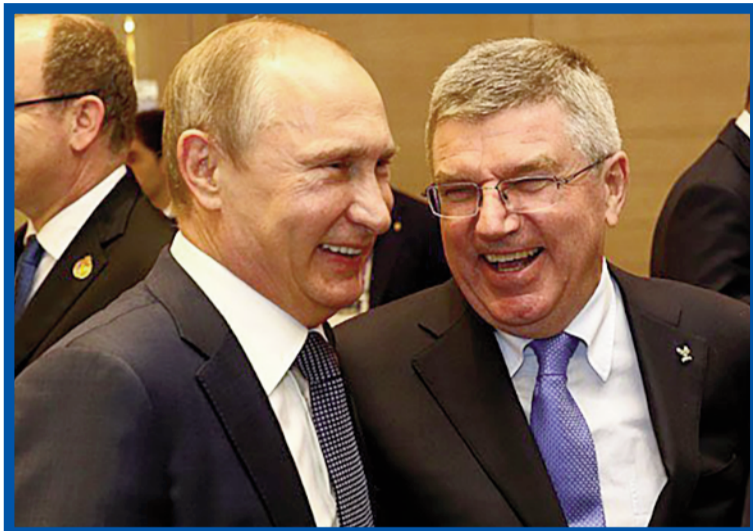
Thomas Bach s Vladimírem Vladimirovičem Putinem.

I přes všechny tyto okolnosti však jednotliví sportovci národnost nezapou, dále budou Rusy či Bělorusy. V domovských zemích bude každá jejich medaile oslavována coby těžce vybojovaná navzdory spiknutí západních mocností. Z Rusů budou vítězo-