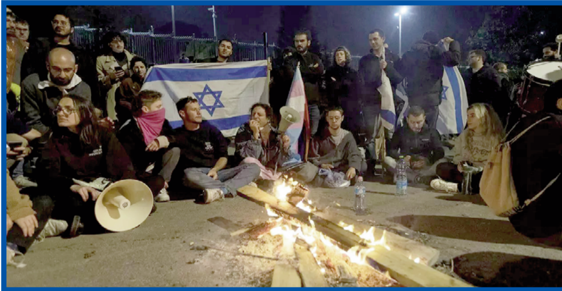
Demonstranti v Tel Avivu.

Kontroverzní reforma soudnictví je výhodná zejména pro samotného premiéra Netanjahu, který čelí několika korupčním obviněním a také podezření ze zneužití moci. Nová legislativa chce změnit výběr soudců Nejvyššího soudu. Ty doposud, jak vysvětlují The New York Times, vybíral devítičlenný výbor složený z pěti právních expertů a čtyř politiků. Nově vláda počítá se zvýšením politických členů výboru – a tedy zpolitizováním výběru soudců Nejvyššího soudu i jeho předsedy.