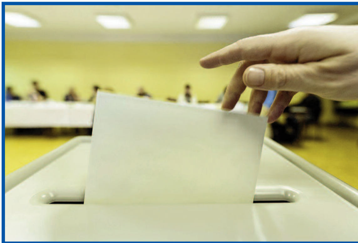
Volby do Poslanecké sněmovny proběhnou 8. a 9. října.

Ústavní soud na začátku února zrušil část volebního zákona z důvodu nespravedlivého rozdělování mandátů mezi politické strany. Dosavadní princip spočíval ve dvou krocích. Celkový počet křesel, tedy 200, se rozdělil mezi kraje na základě počtu odevzdaných hlasů v daném kraji. Počet poslanců, které každá strana získá, se poté roz-