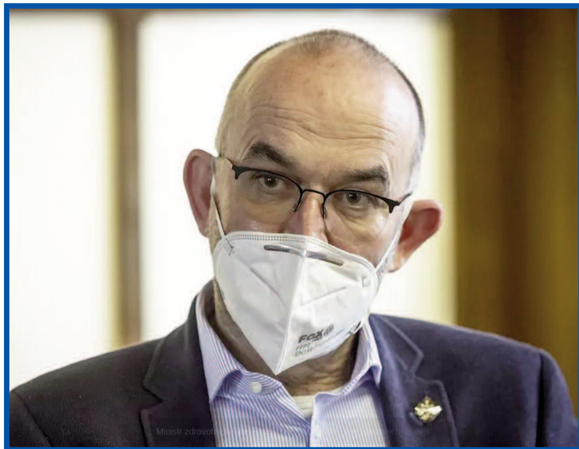
Bývalý ministr Jan Blatný.