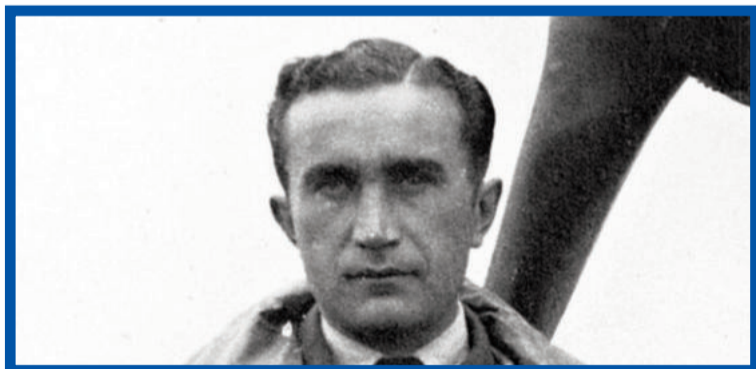
Nejlepší spojenecký stíhač Bitvy o Británii a pravděpodobně neúspěšnější československý stíhač 2. světové války