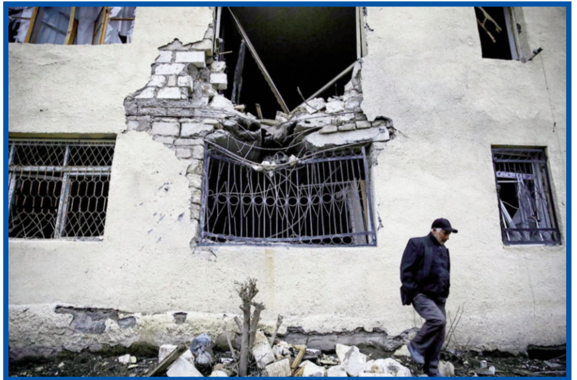
Trosky domu ve městě Terter, které bylo odstřelováno v bojích o Náhorní Karabach.