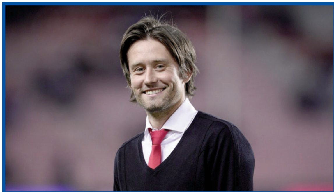
Čerství čtyřicátník Rosický.

OSOBNÍ OCENĚNÍ: Talent roku (1999), Český fotbalista roku (2001, 2002, 2006), Zlatý míč (2002)