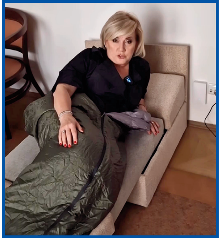
Naděšená skautka Alena Schillerová

Obstrukční kabaret dříve nebo později skončí a vláda skrze neprůstřelnou stoosmičku svůj návrh prosadí. Pohádky ovčí babičky však možná budou mít zajímavou dohru. Opozice chce totiž zákon napadnout u Ústavního soudu. Ten umí přinést zvrat do každého příběhu, vzpomeňme si například na veleúspěšné představení